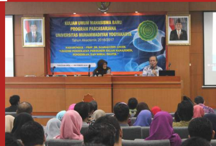
Kegiatan Studium Generale

"S3 Psikologi Pendidikan Islam UMY merupakan program yang mengintegrasikan keilmuan antara Psikologi Umum, dengan Psikologi Islam, hal ini yang tidak ada ditempat lain, begitu juga dengan SDM Dosen bersumber dari Perguruan Tinggi Umum dan Keagamaan, yang terwujud dalam jantung akademik berupa kurikulum yang integrasi."