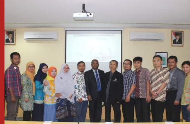
Kegiatan Focus Group Discussion

"Program Doktor UMY memberikan kesempatan kepada semua mahasiswanya untuk menjadi ilmuwan muslim yang memiliki capability tinggi, juga memberikan peluang untuk mengeksplorasi diri segenap potensi unggul yang dimiliki. Dengan suasana pembelajaran yang kondusif dan yaman sehingga tertantang untuk semakin dalam mengkaji ilmu dalam kaitannya dengan Psikologi Pendidikan Islam."