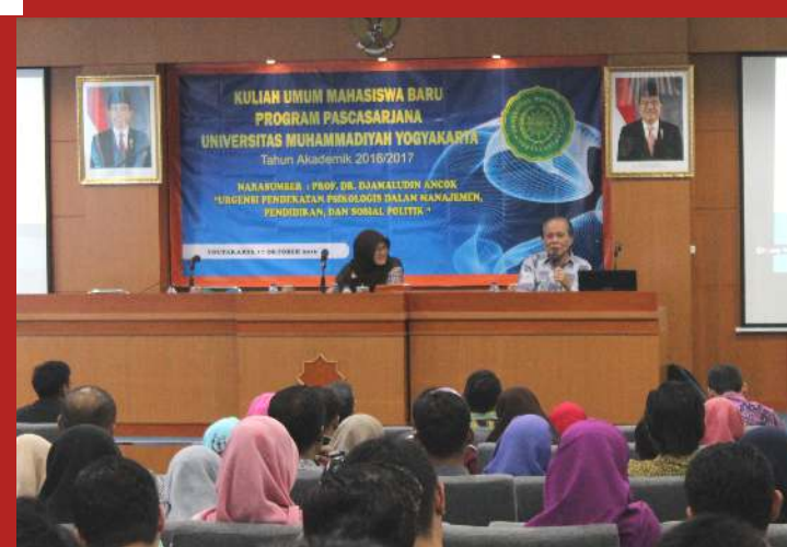
Kegiatan Studium Generale