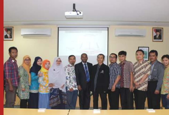
Kegiatan Focus Group Discussion

"Program Doktor UMY memberikan kesempatan kepada semua mahasiswanya untuk menjadi ilmuwan muslim yang memiliki capability tinggi, juga memberikan peluang untuk mengeksplorasi diri segenap potensi unggul yang dimiliki. Dengan suasana pembelajaran yang kondusif dan nyaman sehingga tertantang untuk semakin dalam mengkaji ilmu dalam kaitannya dengan Psikologi Pendidikan Islam."